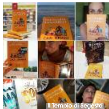
Il Tempio di Segesta

Questa sera alle 21,30 in via Venza a San Vito Lo Capo, Selvaggia Lucarelli presenta il suo ultimo libro "Casi Umani", liberamente ispirato a quattro anni di desolazione sentimentale. Uomini che servivano a dimenticare ma che hanno peggiorato le cose. Selvaggia Lucarelli, scrittrice, editorialista per «Il Fatto Quotidiano» e protagonista di numerosi programmi TV, tra cui Ballando