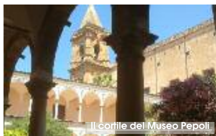
Il cortile del Museo Pepoli

Il Museo di Trapani Agostino Pepoli apre le porte alla mostre dell'artista siciliano Salvatore Caputo, dal titolo "Dal mare, nel mare. Dialoghi equorei attraverso il tempo". La mostra raccoglie, fra quadri e oggetti d'arte, trentasette opere. L'idea da cui nasce questo progetto è quella del dialogo tra arte contemporanea e passato. L'oggetto della mostra è il mare, in senso ampio. Il mare dalle molte facce, che "isola" e fa da "ponte". In un Museo come il Pepoli, in cui - fra le varie collezioni - un'ampia sezione è dedicata ai coralli. Nel tessuto espositivo sono stati inseriti alcuni oggetti d'arte realizzati da Caputo su legni antichi e altri materiali, per ribadire questo incessante dialogo tra ieri e oggi e fra natura e arte.