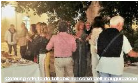
Catering offerto da Lallabis nel corso dell'inaugurazione