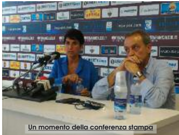
Un momento della conferenza stampa