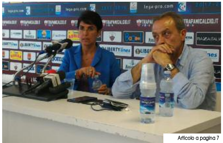
Articolo a pagina 7